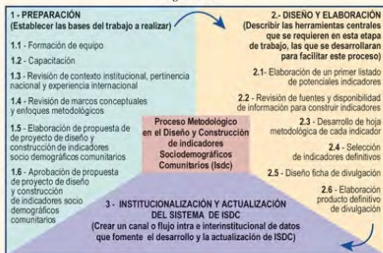
Figura N° 1

De acuerdo a lo señalado en la figura 1, se ha desarrollado hasta la etapa 2 "Diseño y elaboración de indicadores SDC", específicamente la actividad 2.1 "Elaboración de un primer listado de potenciales indicadores", utilizando como fuente de información "Listado de Indicadores de Calidad de Vida" elaborado en el año 2011.