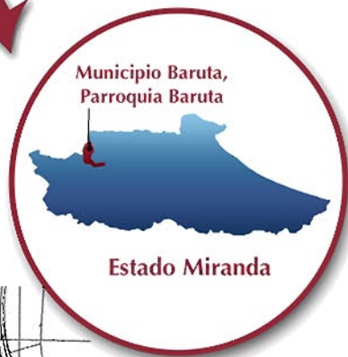
Municipio Baruta, Parroquia Baruta