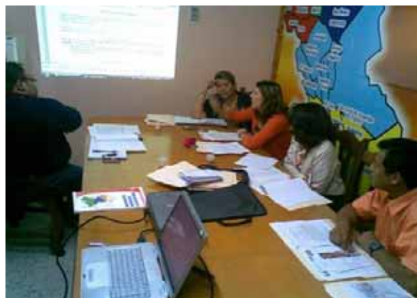
Mesa Técnica RIOFCCEEMA