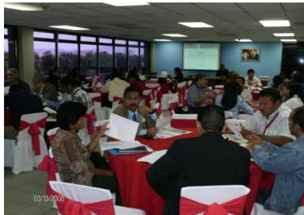
I Plenaria 2008 CCEEMA