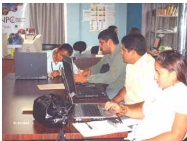
Representantes de: Instituto Nacional de los Espacios Acuáticos (INEA). Instituto de Crédito del Estado Apure. (INCREA), Capacitación de Innovación para Apoyar la Revolución Agraria (CIARA), Instituto Nacional Socialista de Pesca y Acuicultura (INSOPESCA)