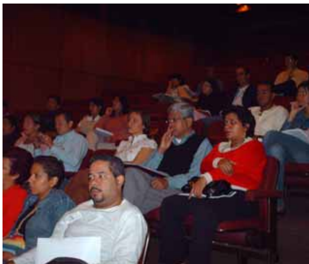
Comité en pleno (marzo 2007)