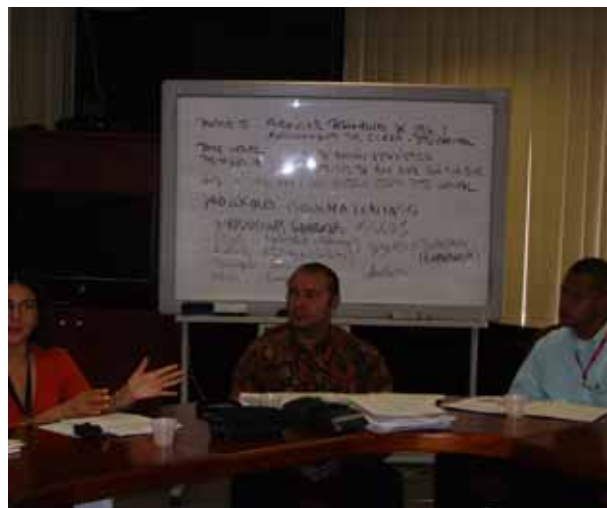
Elaboración de estructura del Reglamento del CCEEM