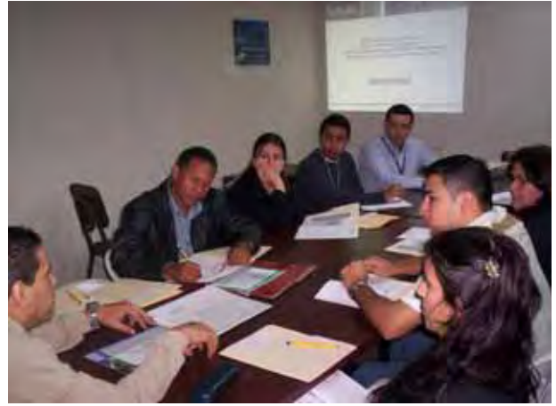
Mesa Técnica del Sector Salud y Desarrollo Social