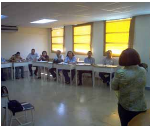
Mesa del Poder Comunal