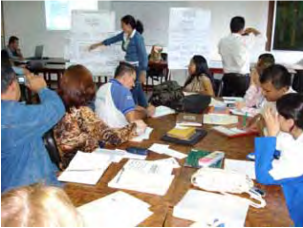
Aspecto del taller del Plan de Acción